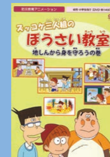
小学生向け (14分) 貸出 No.019

学校の避難訓練時の学習に最適！いつ、どこで起こるか分からない大地震。アニメ番組でもおなじみ「ズッコケ三人組」のキャラクターとともに地震が起きた時の基本的な防災知識と行動を身につける教材です。