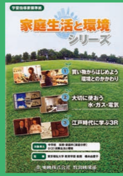
中学生～一般向け (30分) 貸出 No.002

これからはPTA活動でもSDGsを意識したものが求められてくると考えます。例えば親子活動・親子学習などでもSDGsを考える活動をしてみるのも良いのではないのでしょうか。役員会での研修などにも活用できます。