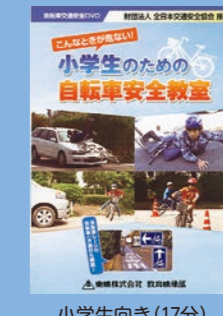
小学生向け (17分) 貸出 No.007

サヤカちゃんの夢の中にピカピカの新しい自転車が現れます。自転車がいつまでも仲良しであるために、正しい例と悪い例を示しながら、自転車の交通ルールを説明していきます。