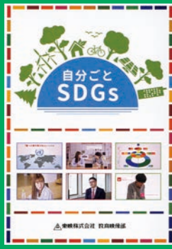
小学生・中学生・保護者 (20分) 貸出 No.031

SDGsとは何かをわかりやすく説明。大きなことではなく自分の身近にできることが多いことを意識できます。また、ペットボトルリサイクルやプラスチックごみの問題を例にSDGsに取り組んでいる人たちのインタビューを見て、身の回りにあるものからSDGsについての考えを深めていきます。