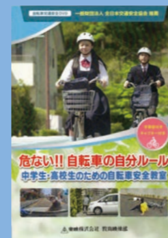
小学生高学年・中学生・一般向け (17分) 貸出 No.032

道路交通法が改正されました！ クローズアップされている 自転車の交通違反の学習に