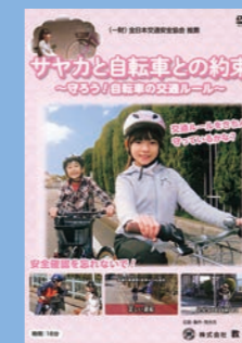
小学生向け (18分) 貸出 No.015

自転車の交通違反のポイントや、交差点などの危険個所における運転上の安全確保の仕方を丁寧に説明しています。また、事故や違反を起こしたときにどうなるかについても解説しています。