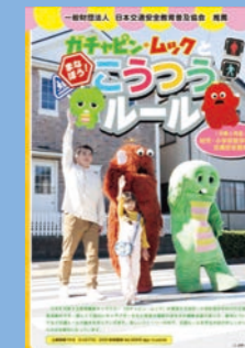
小学生低学年向け (19分) 貸出 No.034

学校の避難訓練時の学習に最適！いつ、どこで起こるか分からない大地震。アニメ番組でもおなじみ「ズッコケ三人組」のキャラクターとともに地震が起きた時の基本的な防災知識と行動を身につける教材です。