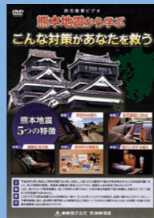
保護者向け (26分) 貸出 No.018

はなかつぱと仲間たちが登場し、「おかしもち」を合言葉に地震が起きたときの命を守る行動を学ぶことができます。また、日ごろから地震に備えるために家庭や学校で気をつけるべきことなどを紹介し、親子で地震に備えることを考えるきっかけにもなります。小学生だけでなく、大人まで参考になる教材です。