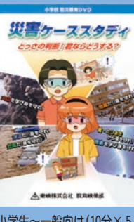
小学生～一般向け (10分×5) 貸出 No.014