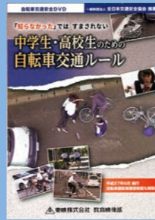
小学生高学年・中学生・一般向け (19分) 貸出 No.016

ガチャピン・ムックと、安全な道路の歩き方や横断歩道の渡り方、信号についてなど、交通ルールの基本を学んでいきます。クイズを交えた楽しいストーリーの中で、交通ルールを守る大切さがよくわかります。