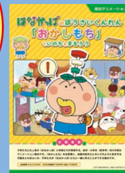
小学生向け (14分) 貸出 No.035